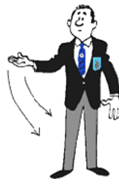
POZIV ZA ZDRAVNIKA