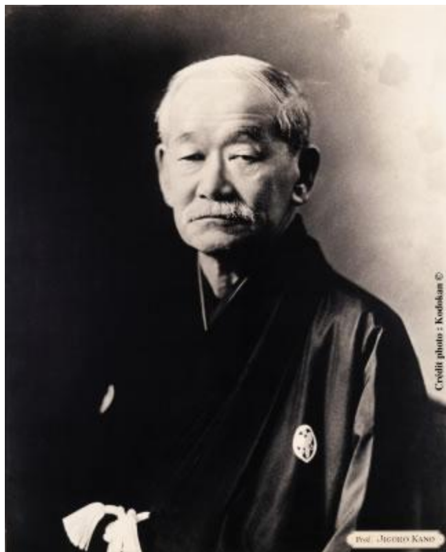
Jigoro Kano – ustanovitelj juda